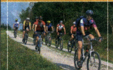
Sport und Aktivitäten