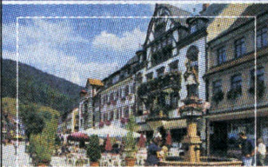
Historischer Stadtkern Wolfach