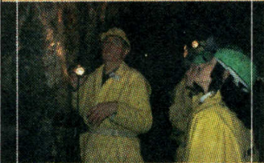
Besucherbergwerk „Grube Wenzel“